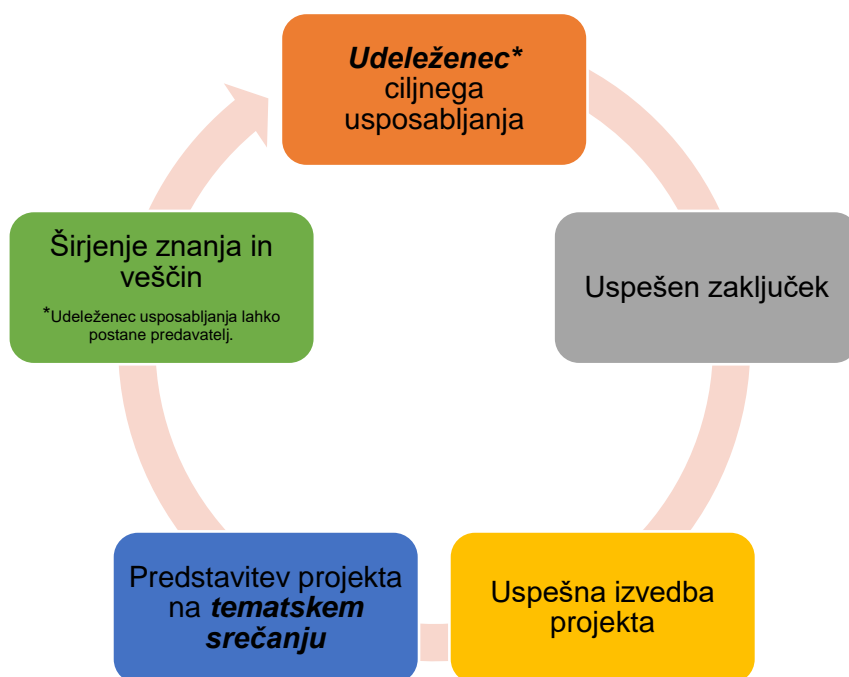
Slika 2: Načrt širjenja znanja in tematskih srečanj

emisij TGP in bolj učinkovito rabo energije. Učinek je dvojni, poleg širjenja informacij udeleženci preteklih ciljnih usposabljanj tako pridobivajo novo znanje in veščine. Ideja tematskih srečanj je tudi možnost za neformalno druženje . Neformalna druženja se lahko izkažejo za pomemben dejavnik reševanja zastojev pri projektih, ker udeleženci med seboj prosto delijo svoja opažanja in ugotovitve, katere omejitve in ovire so najpogostejše pri izvedbi projektov.