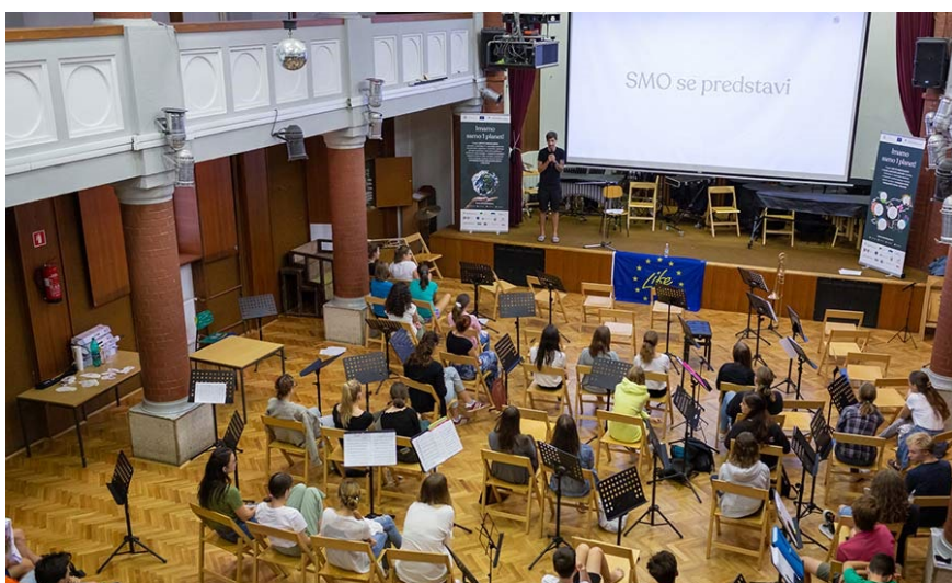
Slika 4 Delavnica s SMO 3