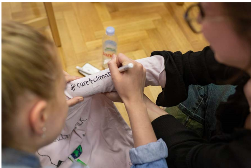
Slika 3 Delavnica s SMO 2