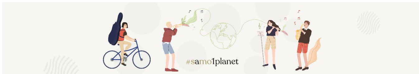
Slika 1 Kreativni material – sodelovanje s SMO

Sodelovanje članov in članic Slovenskega mladinskega nacionalnega orkestra (SMO) ter projekta Care4Climate se je pričelo potem, ko so mladi glasbeniki na družbenih omrežjih zasledili ključna sporočila projekta, jih prepoznali kot zanimiva in nujno potrebna.