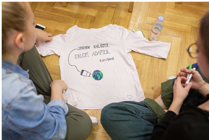
Slika 2 Delavnica s SMO 1