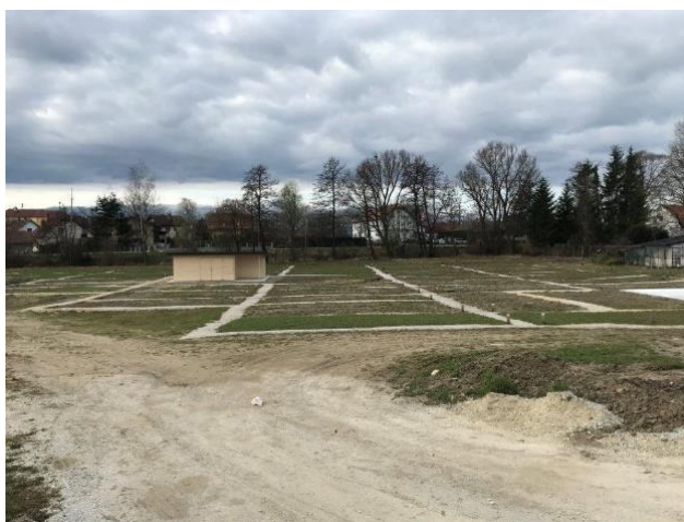
Slika 4: Vrtičkarsko območje ob Mlinski cesti spomladi 2021

V začetku marca 2020 je Mestna občina Ptuj objavila Preveritev interesa za urbano vrtnarjenje na Mlinski cesti (priloga 26), v kateri je občane povabila, da občini prijavijo interes za zakup vrtičkov. Občino smo podprli pri informiranju občanov oziroma gospodinjstev o možnosti zakupa vrtičkov s pripravo letaka in njegovim razdeljevanjem v poštne nabiralnike v blokovskih naseljih na območju občine (študentsko delo tik pred razglasitvijo epidemije). Interes je prijavilo 23 občanov, pri čemer je na zemljišču ob Mlinski cesti predvidena ureditev 42 vrtičkov. Občina je bila s tem rezultatom zadovoljna. Posvetila se je pripravi občinskega odloka o urbanih vrtovih, ki je bil sprejet 23. maja 2020 in na občinskih vrtičkih zapoveduje ekološko vrtnarjenje. Na občinski spletni strani je občina objavila javni poziv za zakup vrtičkov, ki je še vedno odprt (november 2021) (priloga 27).