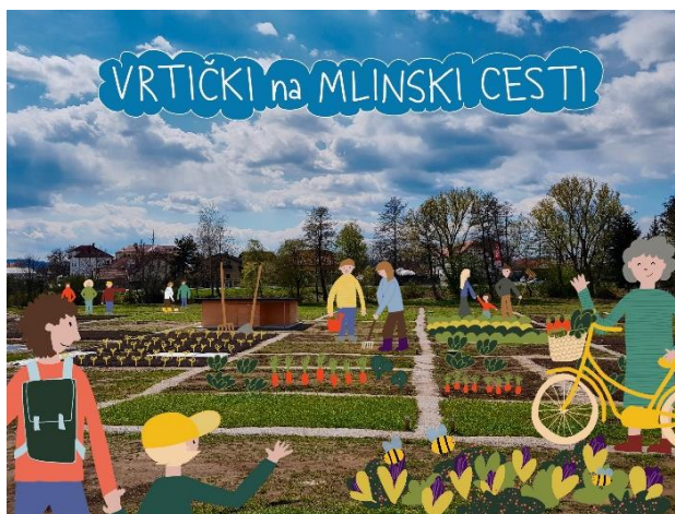
Slika 5: Ilustracija na plakatu Vabljeni med ptujske vrtičkarje

Spomladi 2021 smo podporo občini nadaljevali s pripravo načrta komuniciranja in aktivnosti v obdobju priprav na novo vrtičkarsko sezono (priloga 28). Pripravili smo objavo za občinsko glasilo Ptujčan (priloga 29) ter oblikovali plakat z vabilom občanom, da se pridružijo ptujski vrtičkarski skupnosti.