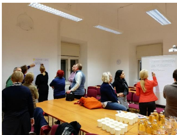
Slika 2: Delavnica Urbani vrtovi po meri lokalne skupnosti