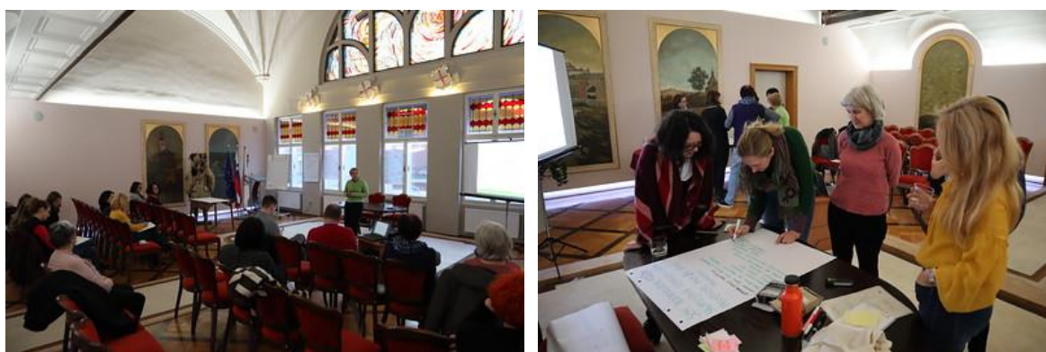
Slika 3: Delavnica Lahko bi delovali tudi ... na vrtu

Druga delavnica z naslovom Lahko bi delovali tudi na vrtu je bila 11. februarja 2020 v prostorih Mestne občine Ptuj. Delavnice se je udeležilo 17 udeležencev, od tega 5 predstavnikov lokalnih civilnodružbenih organizacij (priloga 21). V vsebinski predstavitvi, s katero smo začeli delavnico, je bil poudarek na predstavitvi možnih dejavnosti civilnodružbenih organizacij na skupnostnih vrtovih na primerih različnih dobrih praks (priloga 20). V delavniškem delu smo udeležence povabili k razmisleku o možnih dejavnostih, ki bi jih ptujске civilnodružbene organizacije lahko izvajale na občinskem skupnostnem vrtu. Z uporabo metode vrtiljak smo zabeležili potrebe in dejavnike, ki bi civilnodružbene organizacije spodbudili k delovanju na skupnostnem vrtu, ter pričakovanja glede koordinatorja.